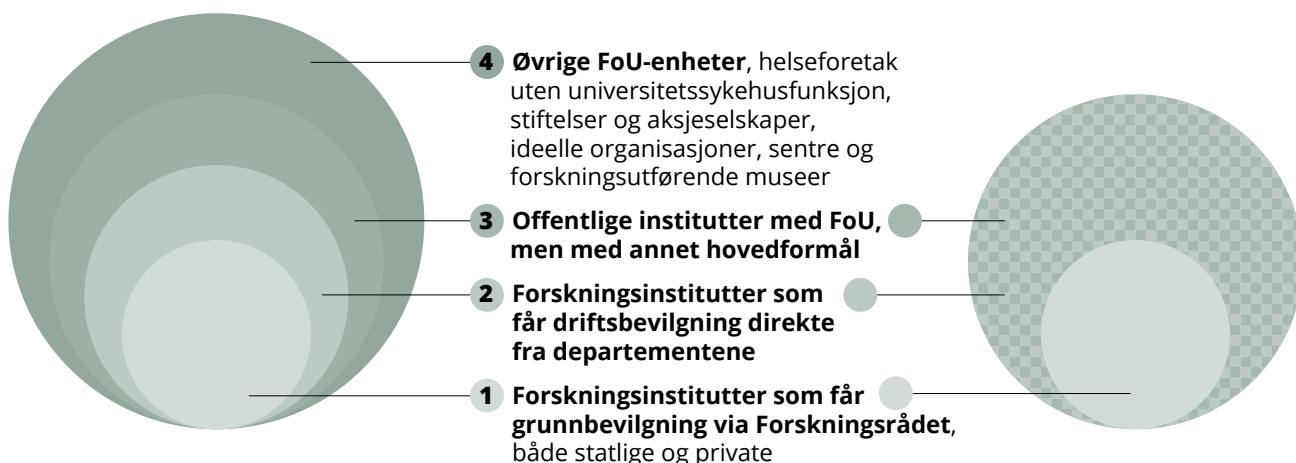
Figur 2 Sirkelen på høyre side viser hvem instituttpolitikken gjelder for.