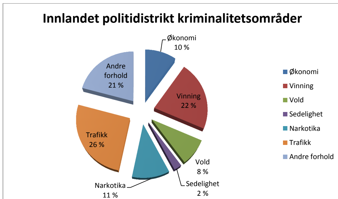
Fordelingen av anmeldt kriminalitet i Innlandet i 2019

Nedenfor vises den prosentvise fordelingen av anmeldt kriminalitet i Innlandet politidistrikt i 2019. Politidistriktet mottok totalt 19 399 anmeldelser i 2019.