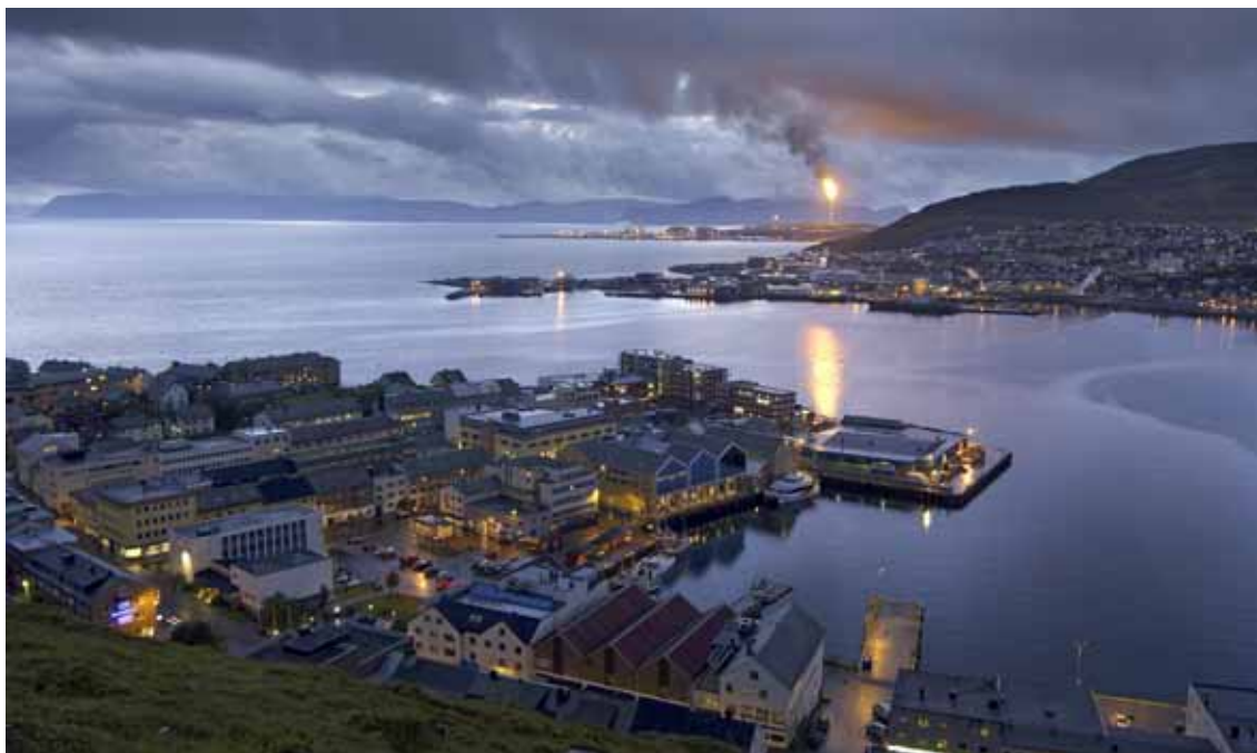
Melkøya ved Hammerfest.

Kystverket har utført en kartlegging av hvilke havner i Øst-Finnmark som er egnet for lokalisering av en eventuell oljebase. Kirkenes er eneste havn som egner seg uten større utbygging.