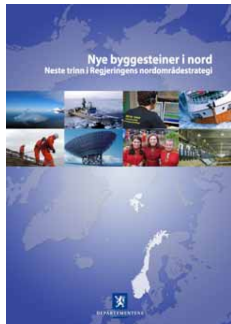
Rapporten "Nye byggesteiner i nord" ble lagt frem i mars 2009

Dette særtrykket er ment å gi en kort status for hvor langt man er kommet på de 7 satsingsområdene i "Nye byggesteiner i nord". Den beskriver kort hvilke tiltak og prosjekter som allerede er gjennomført og hva som gjenstår. Vi håper at brosjyren har funnet en form som også bidrar til å nå ut til enda flere med informasjon om den brede nasjonale satsingen nordområdepolitikken legger opp til.