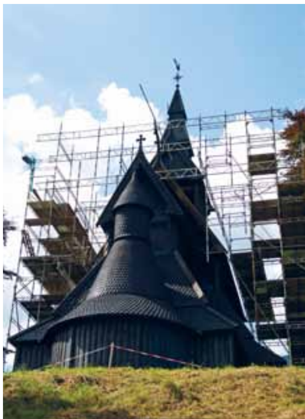
Hopperstad stavkyrkje, Vik kommune. Kyrkja blei istandsatt i 2008.

frie inntekter (Meld. St. 1 (2010–2011) Nasjonalbudsjettet 2011).