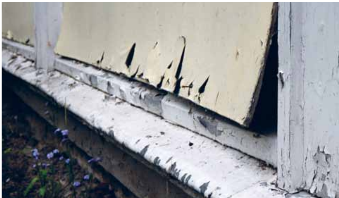
Grinilund kyrkje, Bærum (2011). I tilstandsvurderinga frå 2009/10 er det oppgitt at ytterveggene på kyrkja har tilstandsgrad 3.