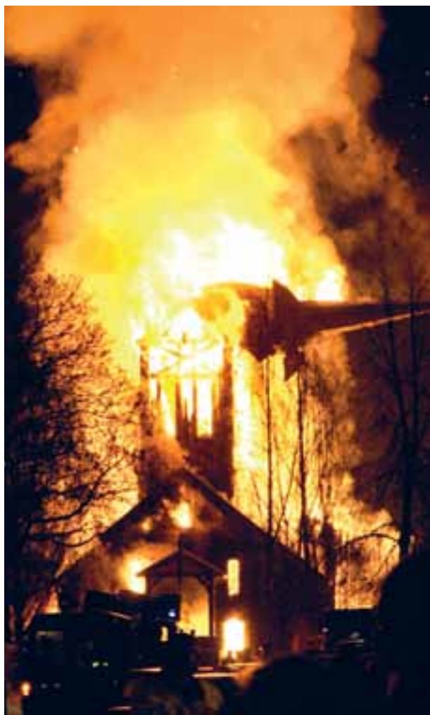
Hønefoss kyrkje brann ned til grunnen i januar 2010.

Dei freda kyrkjene har hatt størst endring i tilstand på yttervegger. Tal frå tilstandsvurderingane viser at delen med utilfredsstillande tilstand er redusert frå 44 til 25 prosent. For yttertak og tårn er det kyrkjene som er bygde i perioden 1650–1850 som har hatt størst reduksjon i delen utilfredsstillande tilstand, frå 32 til 21 prosent. Tilstandsvurderingane av grunn og fundament viser at det for dei freda kyrkjene har vore ein svak auke i delen med utilfredsstillande tilstand. Frå 2005/06 til 2009/10 har delen auka frå 15,1 til 15,5 prosent.