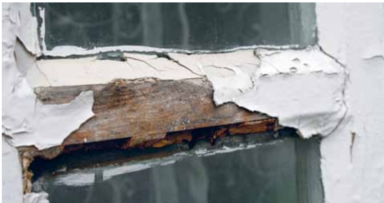
Trøgstad kyrkje (2011).