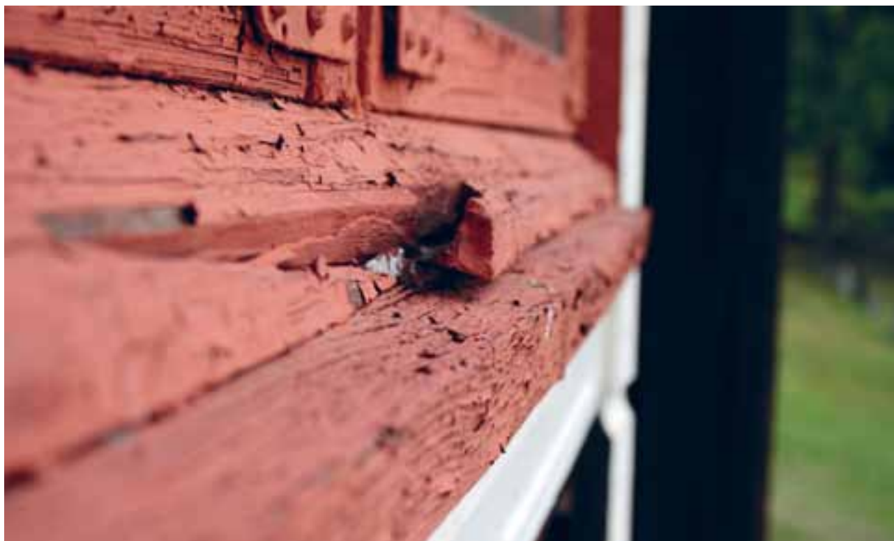
Filtvet kyrkje (2011). I tilstandsvurderinga frå 2009/10 er det oppgitt at ytterveggene på kyrkja har tilstandsgrad 2.