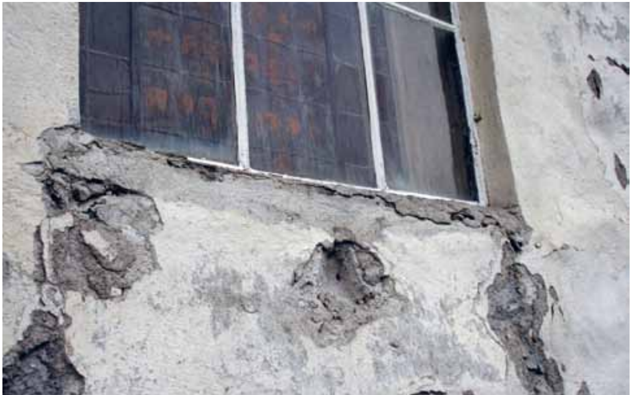
Kråkstad kyrkje, Ski (2011). I tilstandsvurderinga frå 2009/10 er det oppgitt at ytterveggen på kyrkja har tilstandsgrad 2.