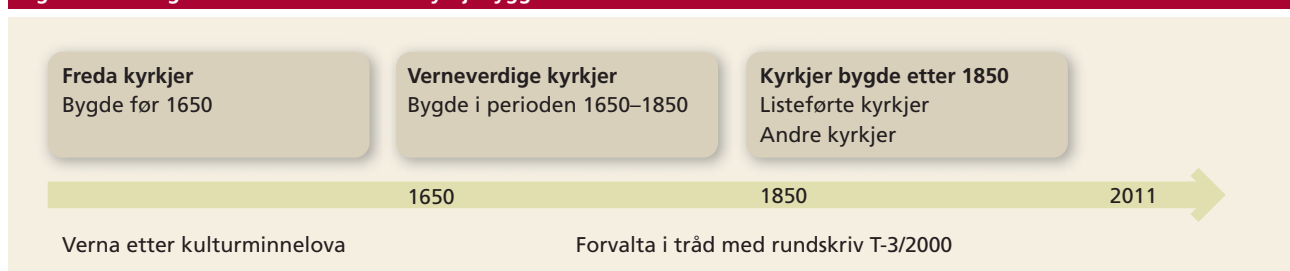
Figur 1 Alder og vernestatus for norske kyrkjebygg

Tilstandsvurderinga viser at tilstanden til 586 kyrkjer, altså 37 prosent, er vurdert som utilfredsstillande. Tilstanden til 993 kyrkjer, altså 63 prosent, er vurdert som tilfredsstillande. Utilfredsstillande tilstand tyder tilstandsgrad 2 eller 3. Tilfredsstillande tilstand tyder tilstandsgrad 0 eller 1.