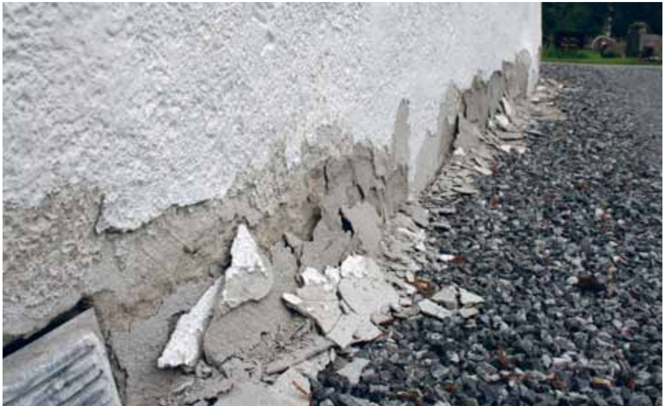
Idd kyrkje, Halden (2011). I tilstandsvurderinga frå 2009/10 er det oppgitt at ytterveggene på kyrkja har tilstandsgrad 3 og grunnmur og fundament tilstandsgrad 2.