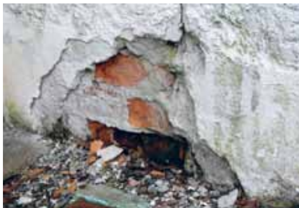
Trøgstad kyrkje (2011). I tilstandsvurderinga frå 2009/10 er det oppgitt at ytterveggene på kyrkja har tilstandsgrad 2, tak og tårn tilstandsgrad 3 og grunnmur og fundament tilstandsgrad 1. Kyrkja er freda.