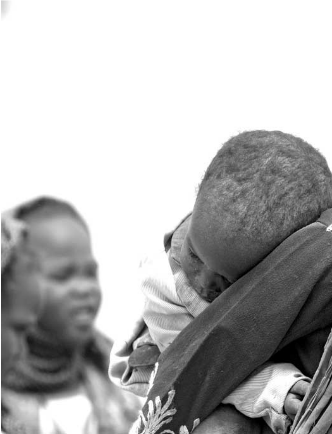
Søsken i flyktningleir, Tsjad.