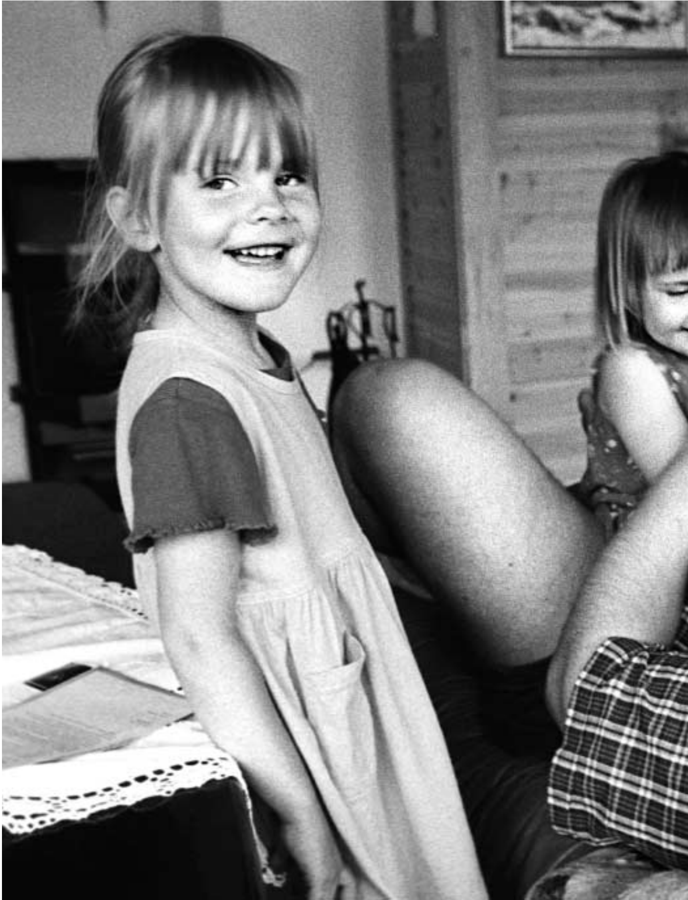
Far og døtre, Norge.