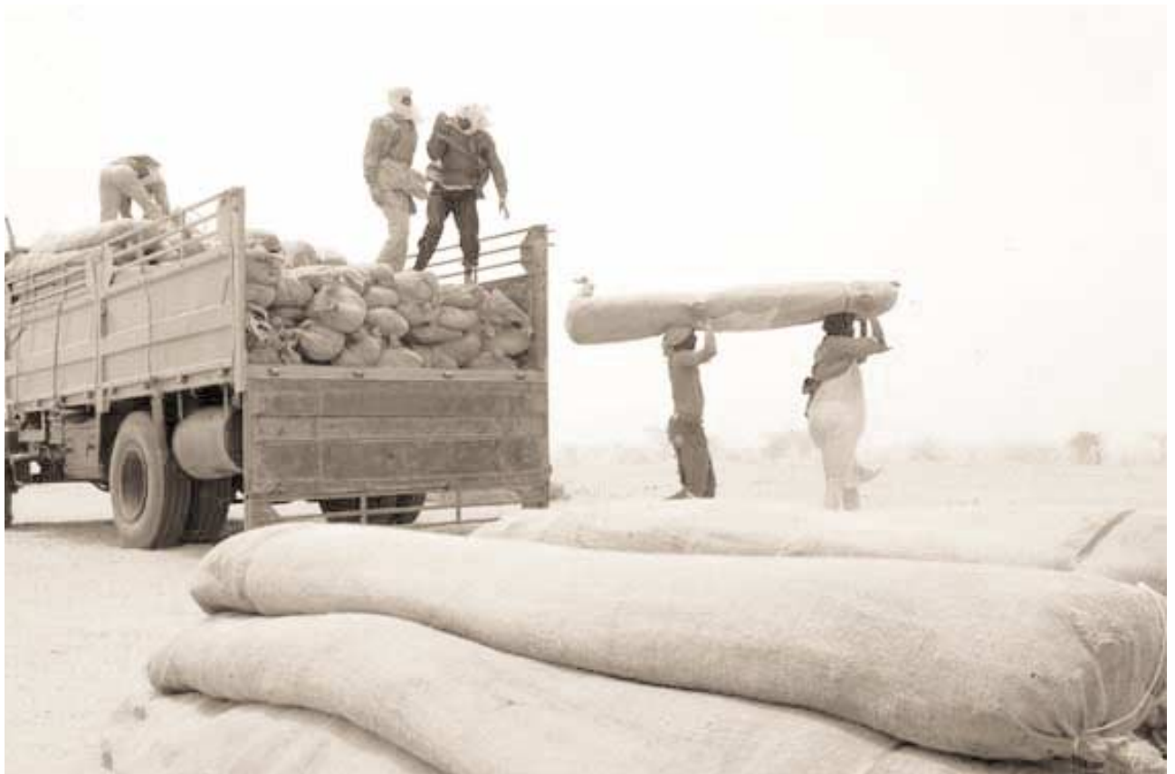
Telt til flyktninger fra Darfur, Tsjad.

folkevalgte organer også skal ha en sentral rolle i dette arbeidet. PRSP-prosessen, som også er en betingelse for gjeldslette under HIPC (Heavily Indebted Poor Countries Initiative), leder derfor både direkte og indirekte til økt implementering av sosiale og økonomiske rettigheter, styrking av politiske og sivile rettigheter og økt demokratisering