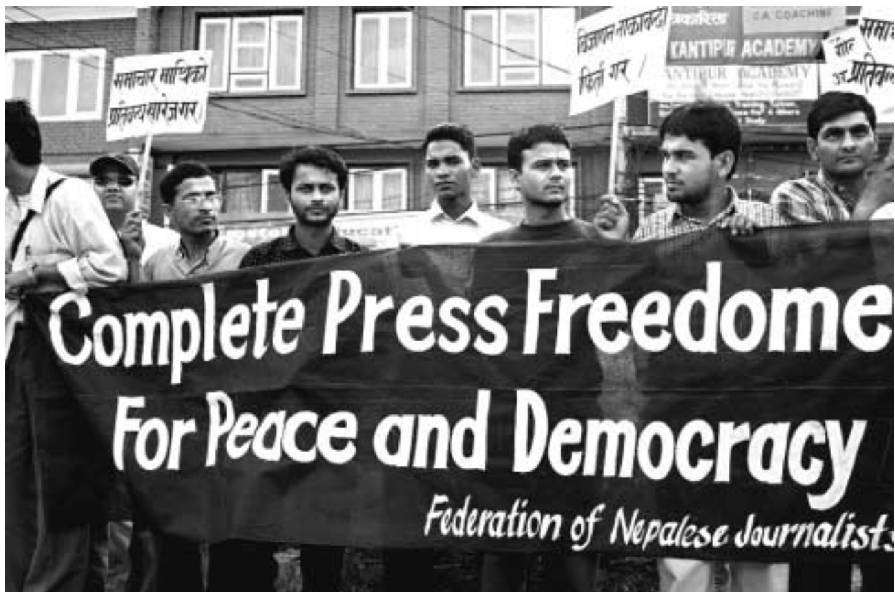
Journalister demonstrerer i Kathmandu.

utviklingsland i 2004 og 2005. Disse aktørenes rolle og forankring i norsk samfunnsliv gir gode forutsetninger for å kunne bidra til kapasitetsbygging og styrke aktiviteten til de nasjonale samarbeidspartnere.