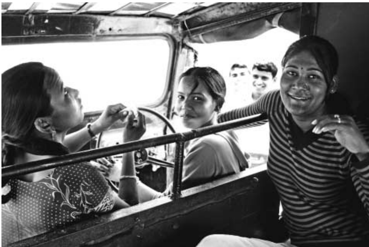
Kjøreopplæring i Nepal.

UNIFEM, deriblant NOK 6,5 mill. i post-tsunami bistand og NOK 3,5 mill. til styrking av kvinners stilling i Sør-Sudan.