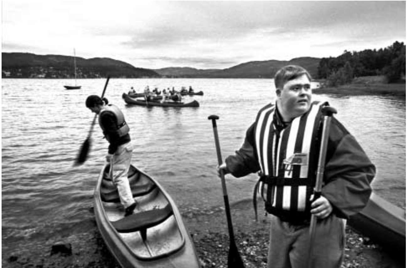
Leir for funksjonshemmede, Haraldsheimen, Norge.