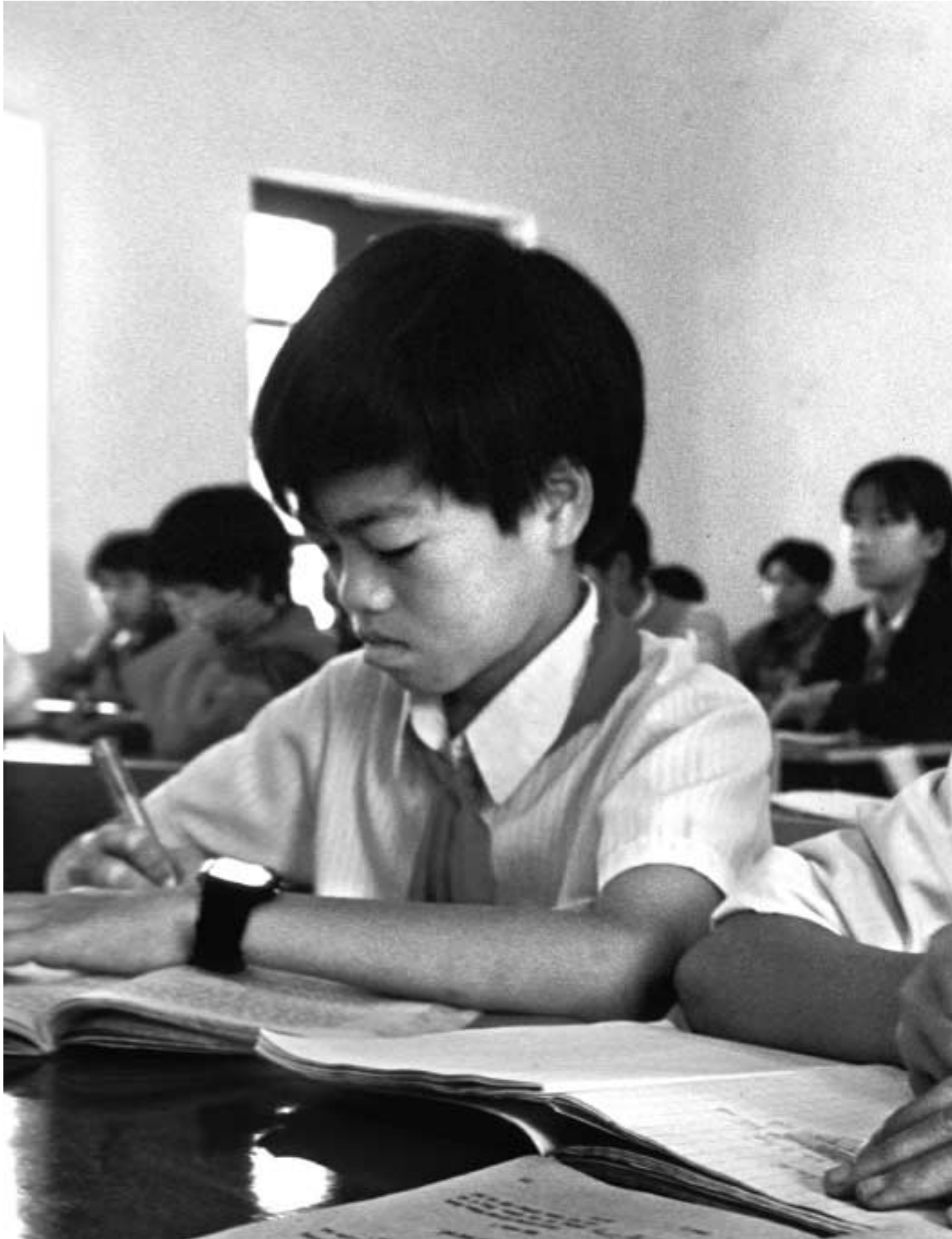
Skolebarn i Vietnam.