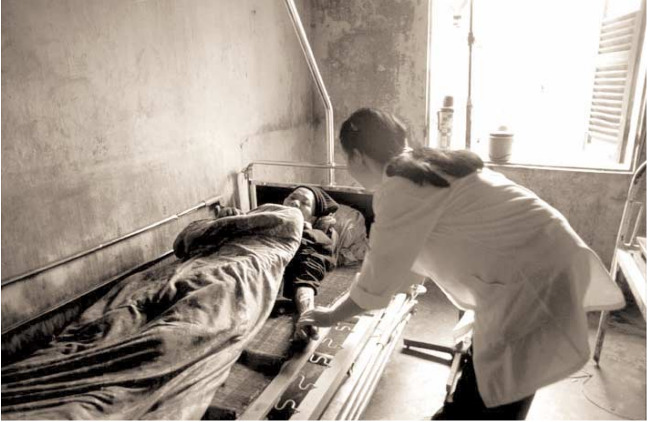
Pasient og lege, Vietnam.