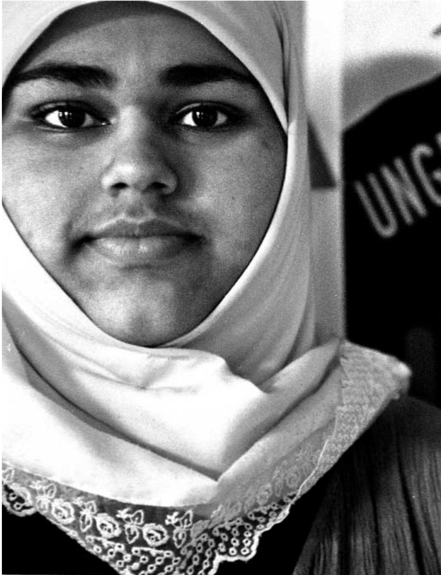
Antirasistisk senter, Oslo