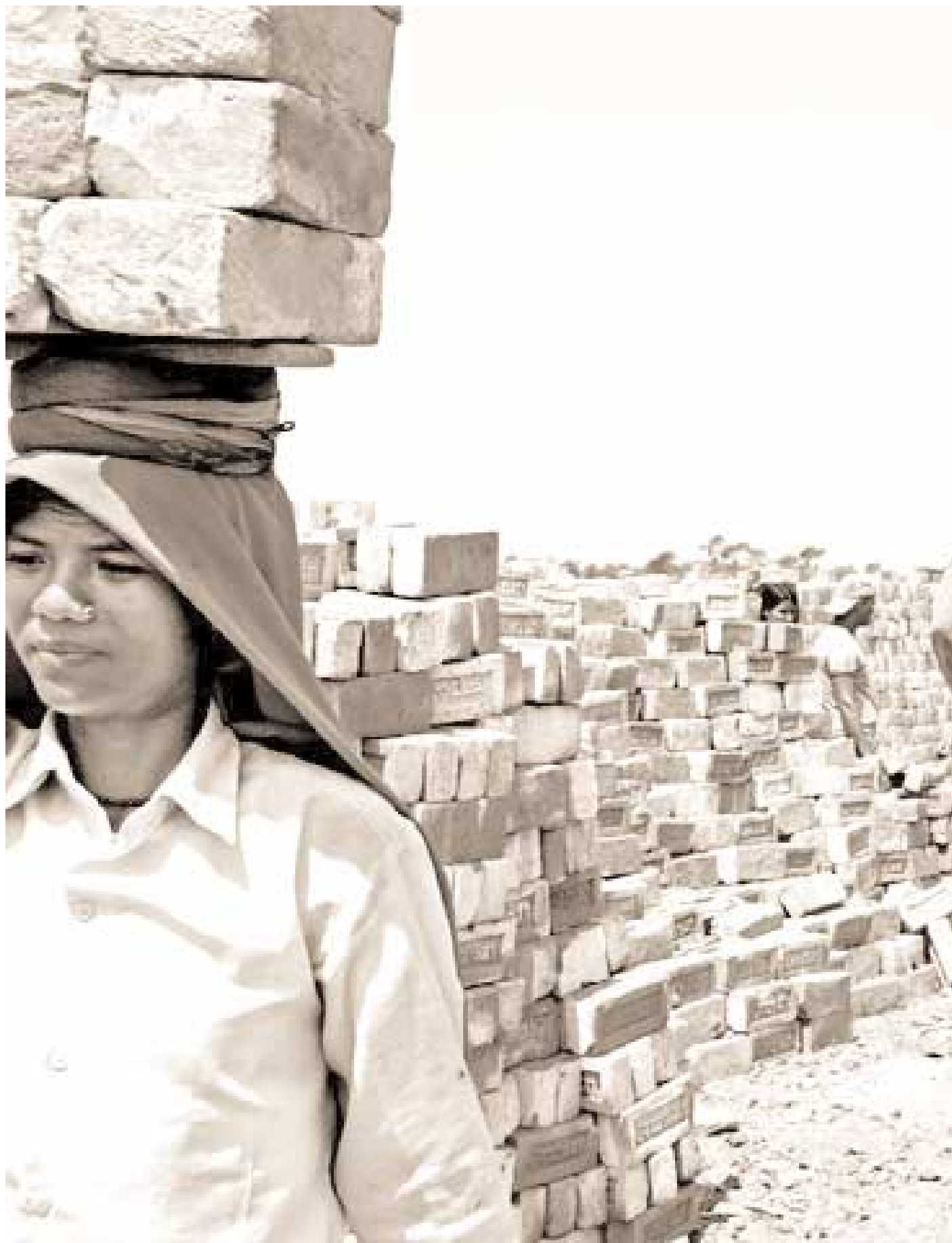
Barn i arbeid, Nepal.