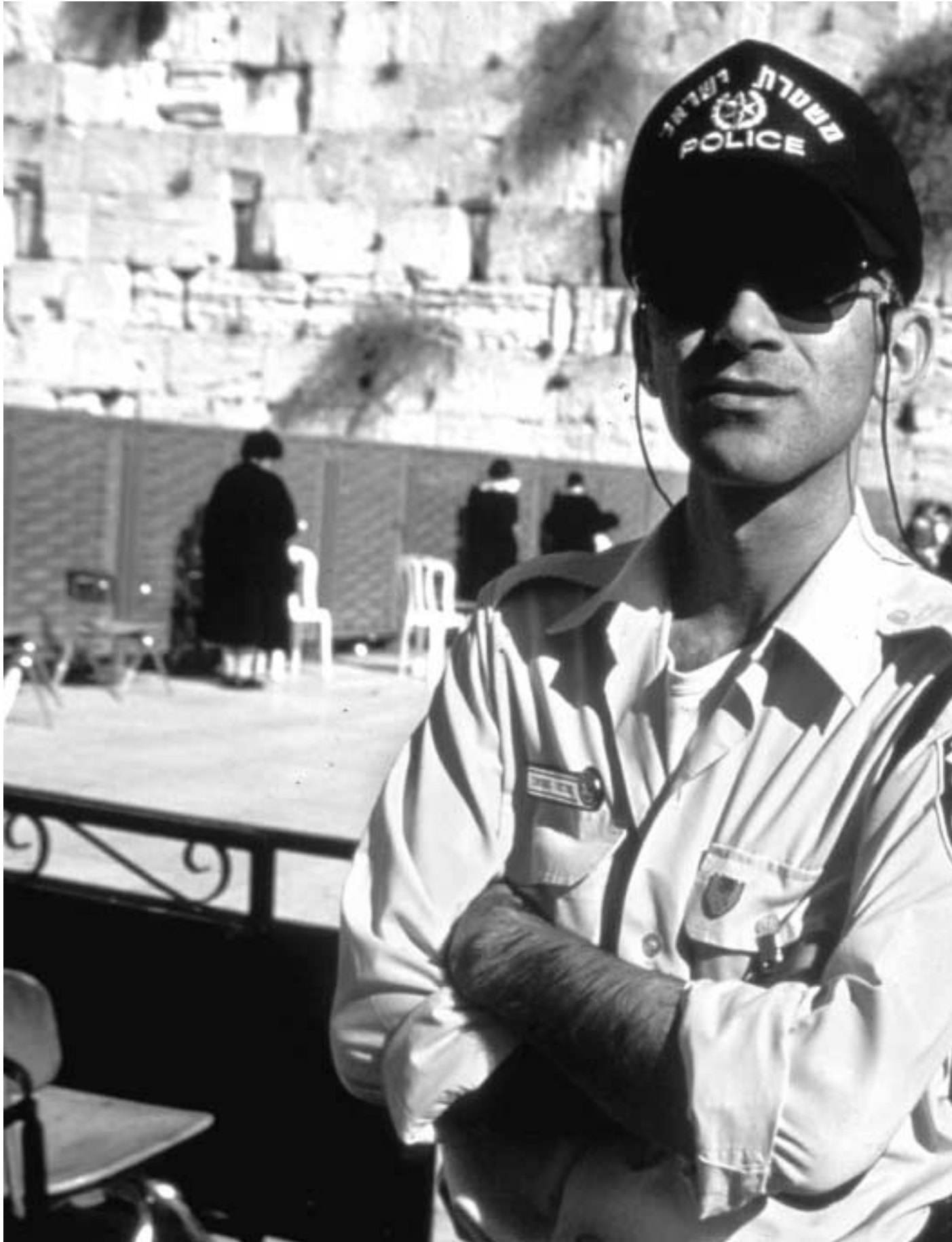
Politi ved klagemuren i Jerusalem.