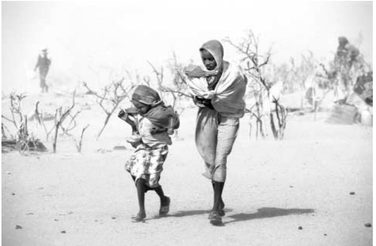
Mor og datter på flukt over grensen fra Darfur til Tsjad.

sigbar finansiering av humanitært arbeid og bedre samordning og partnerskap mellom de ulike humanitære aktørene, delfinansierte en internasjonal utredning, "Humanitarian Response Review", vedrørende forbedringer av den humanitære innsats som siktemål.