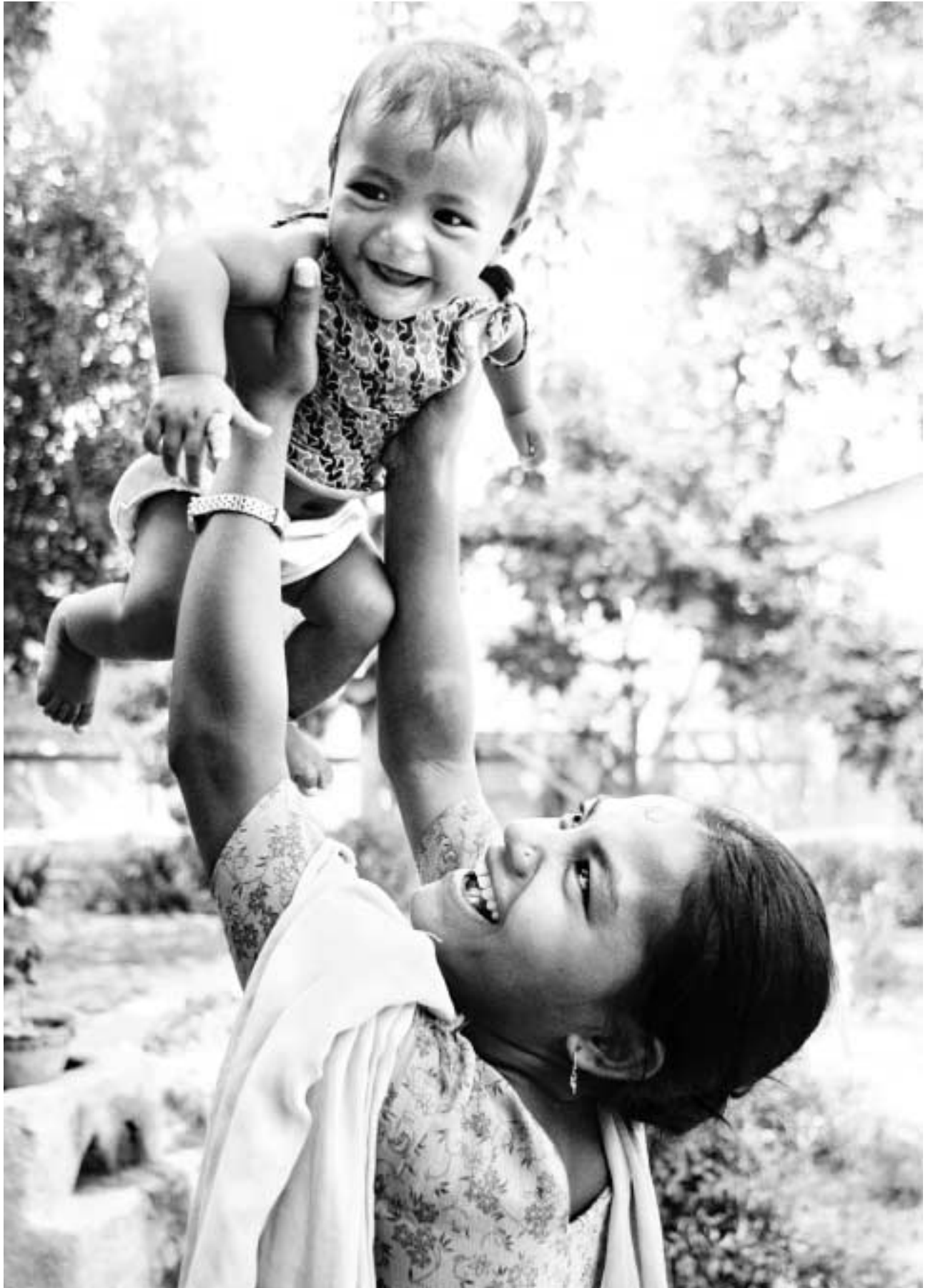
Mor og datter, Nepal.