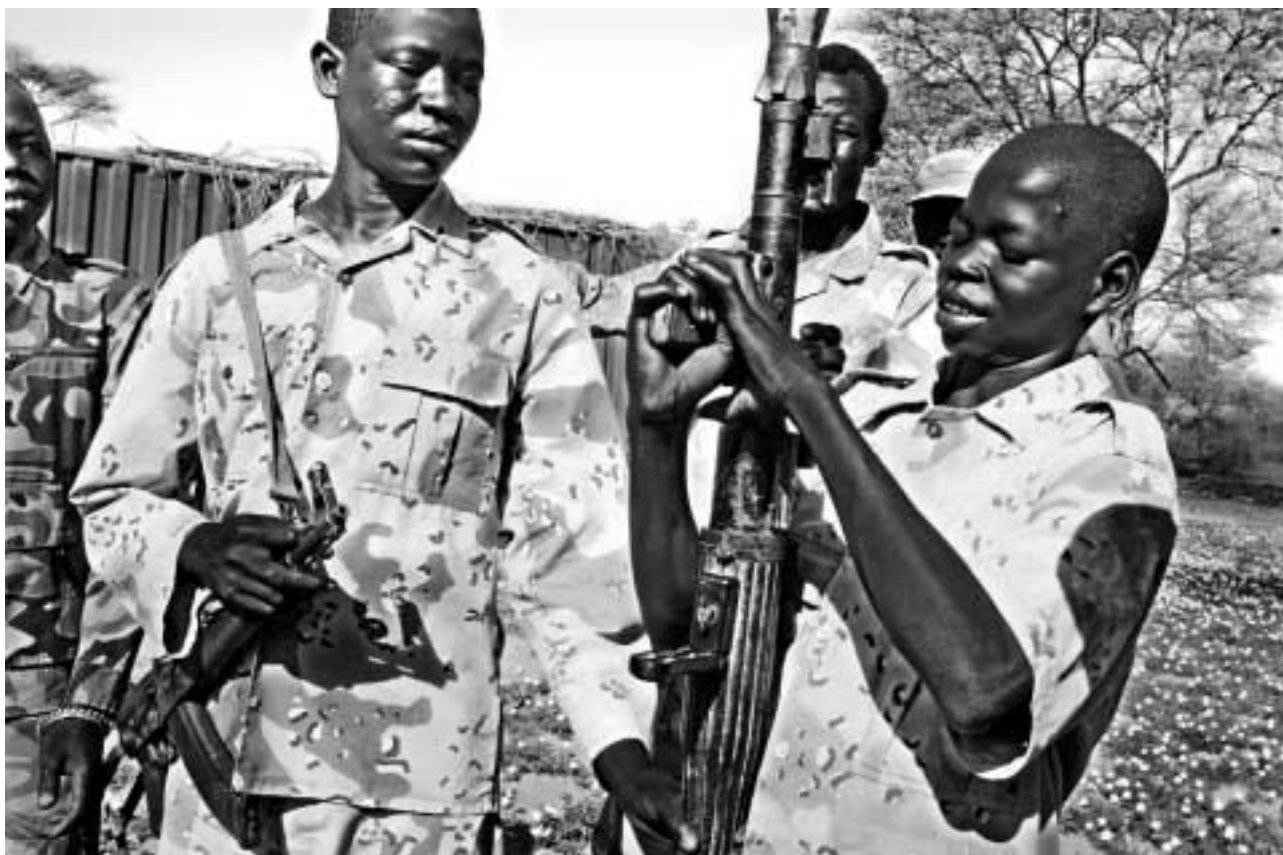
Barnesoldat, Sør Sudan.

hovedsiktemål med innsatsen for å øke humanitære hjelpearbeideres sikkerhet og det humanitære hjelpeapparatets yteevne.