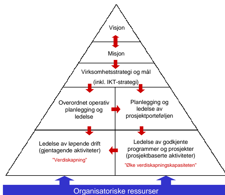
Figur 3 Styringspyramiden

IKT-strategien 2008-2010 synes å være noe fragmentert og mangelfull. Det savnes en tydelig kobling mot virksomhetens overordnede visjon, strategier og mål. Ved en fremtidig revidering av IKT-strategien bør det skilles klarere mellom det strategiske innholdet og tiltakene/prosjektene.