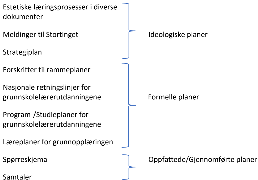
Figur 1.1 Oversikt med utgangspunkt i Goodlads nivåtenkning.

eller ideologiske planer. Formelle planer er forskrifter og planer som det er gitt føringer om i forskriftene for grunnskolelærerutdanningene, slik som retningslinjer og programplaner/studieplaner. Informasjonen vi har fått gjennom spørreskjema og samtaler med ansatte på institusjonene vil kunne sammenlignes med Goodlads nivå oppfattede læreplaner med et blikk inn i gjennomførte læreplaner , i alle fall slik våre informanter forteller. Spørreundersøkelsen og samtalene med institusjonene knyttes særlig til de to siste nivåene.