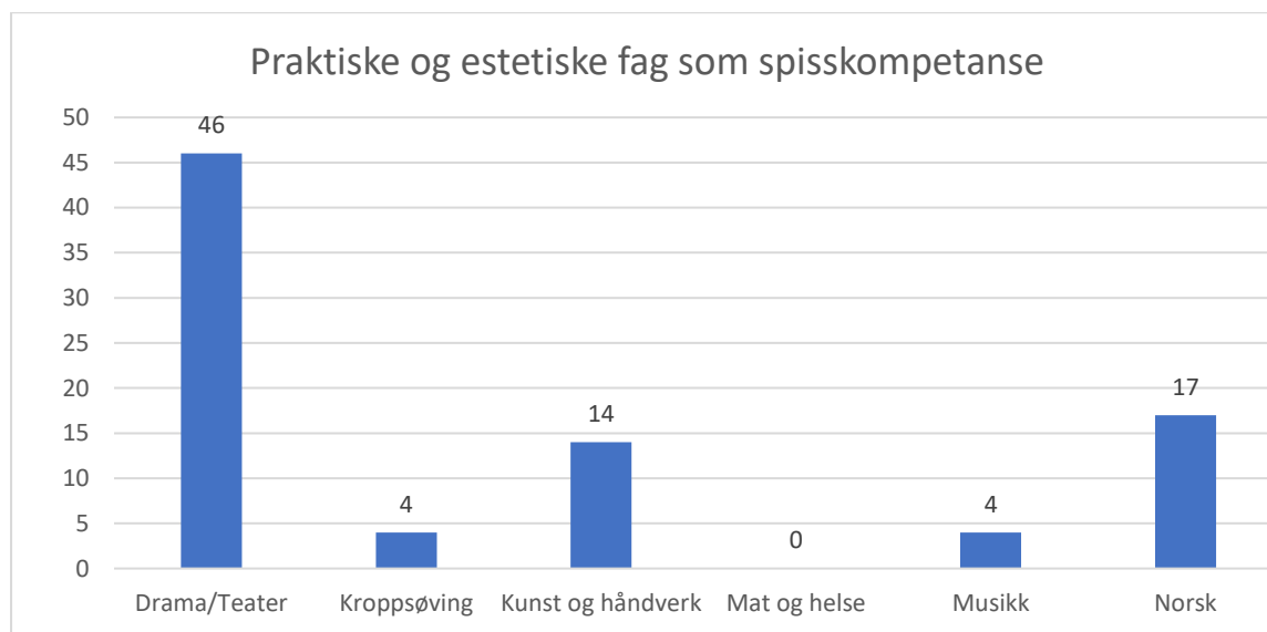
Figur 4.1 Antall ganger de praktiske og estetiske fagene eller fagenes fagbegreper er nevnt i spørreundersøkelsen

Det er ikke spurt direkte om de praktiske og estetiske fagene drama/teater, kunst og håndverk, kroppsøving, mat og helse og musikk, samt norsk, har en rolle i de estetiske læringsprosessene knyttet til arbeids- og uttrykksformer, virkemidler, verktøy, faguttrykk etc. i fagene. I de fleste svar fra institusjonene nevnes likevel disse fagene. Figuren nedenfor viser om lag hvor mange ganger fag og/eller fagenes faguttrykk og begreper er nevnt eller brukt i de skriftlige svarene fra de 13 institusjonene.