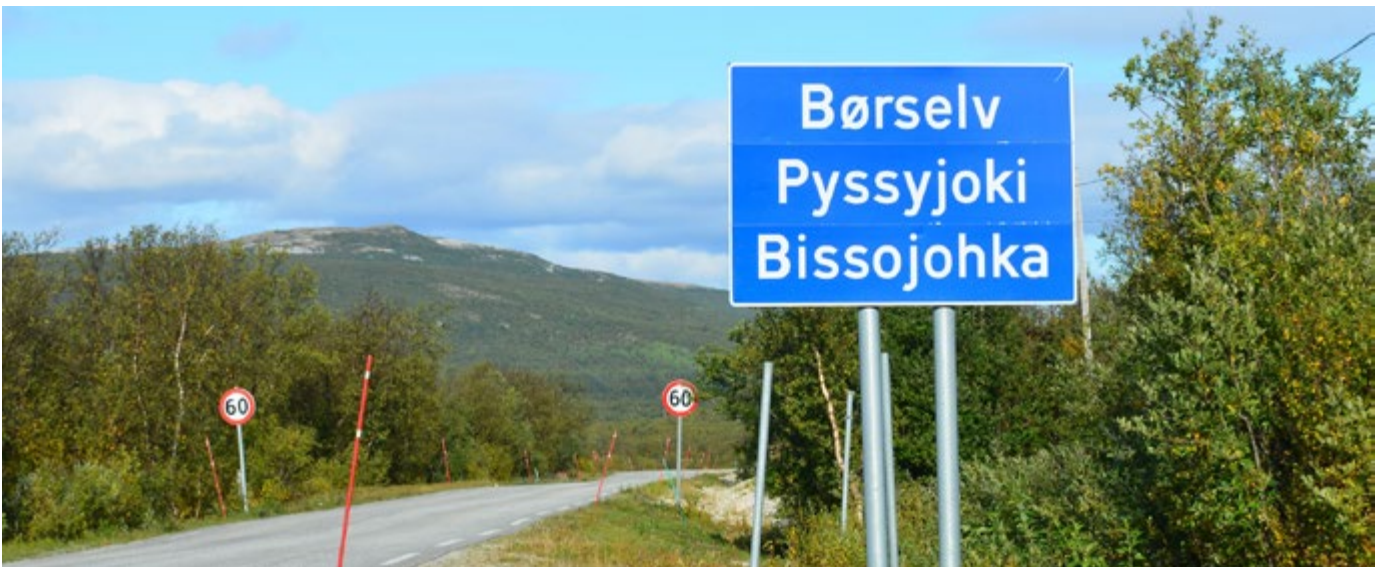
Trespråklig skilt.

Finsk som andrespråk har kompetansemål etter 2., 4., 7. og 10. årstrinn i grunnskolen, og i videregående skole etter Vg1, Vg2 og Vg3 i studieforberedende utdanningsprogram, og i yrkesfaglige utdanningsprogram etter Vg2 og etter Vg3 påbygging til generell studiekompetanse.