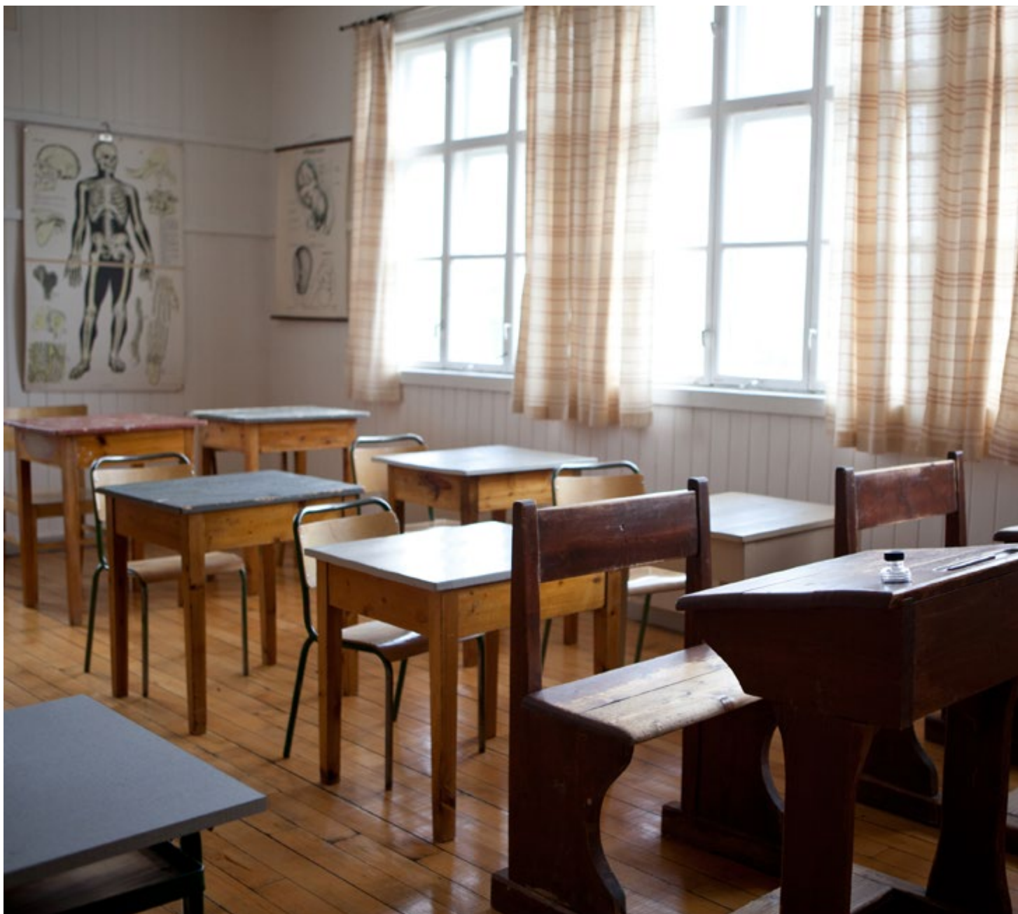
Klasserom, Strand skoleinternat.