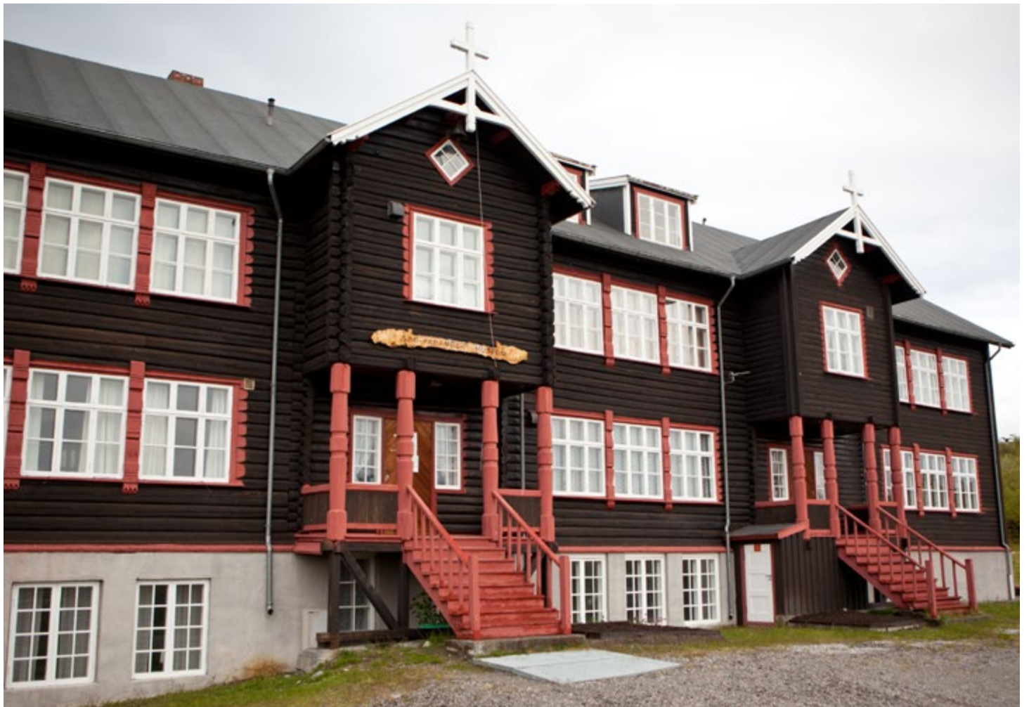
Strand skoleinternat ble bygget i 1905, og ble et symbol på styrking av norsk suverenitet i Pasvikdalen.