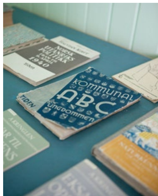
Bøker, Strand skoleinternat.