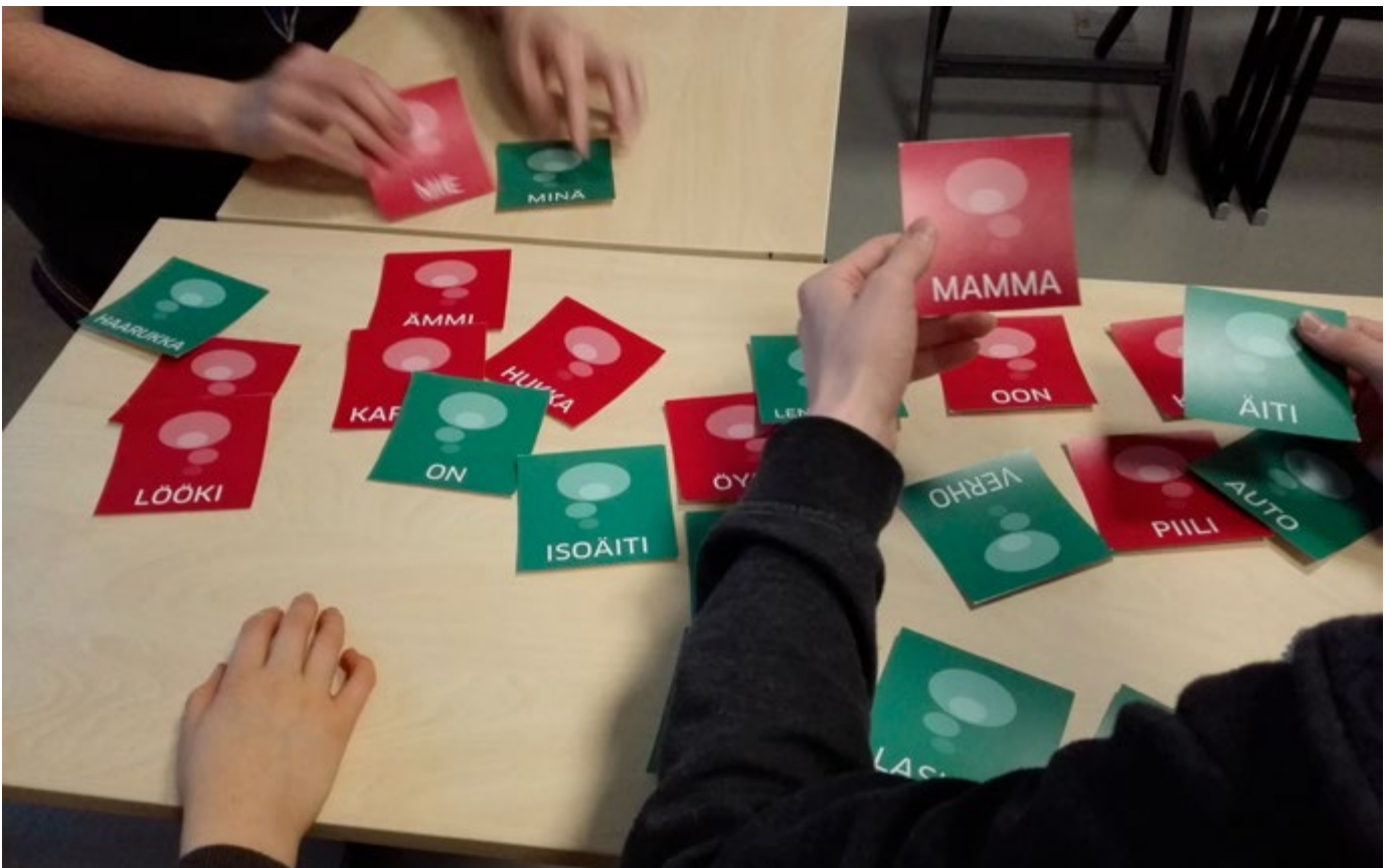
Halti kvenkultursenter hadde besøk av finskelever fra Reisa Montessoriskole i februar 2017. De fikk blant annet bryne seg på en språklek der de skulle finne ord på kvensk og finsk som betyr det samme.