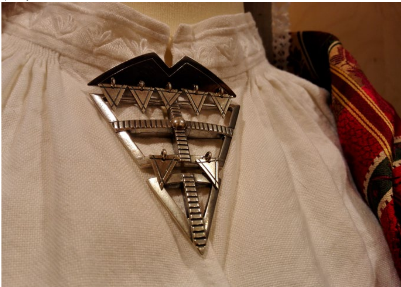
Utsnitt av kvenndraktens midtsølje (kvinndrakt).