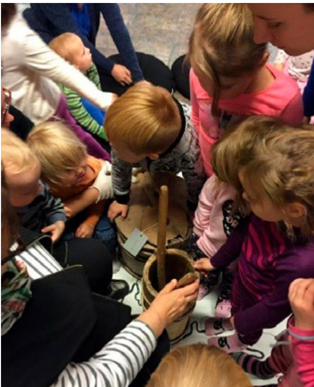
Språkreir i barnehagen.