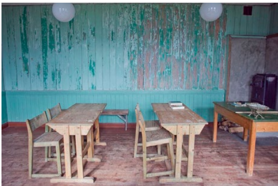
Klasserom Andersby skole.