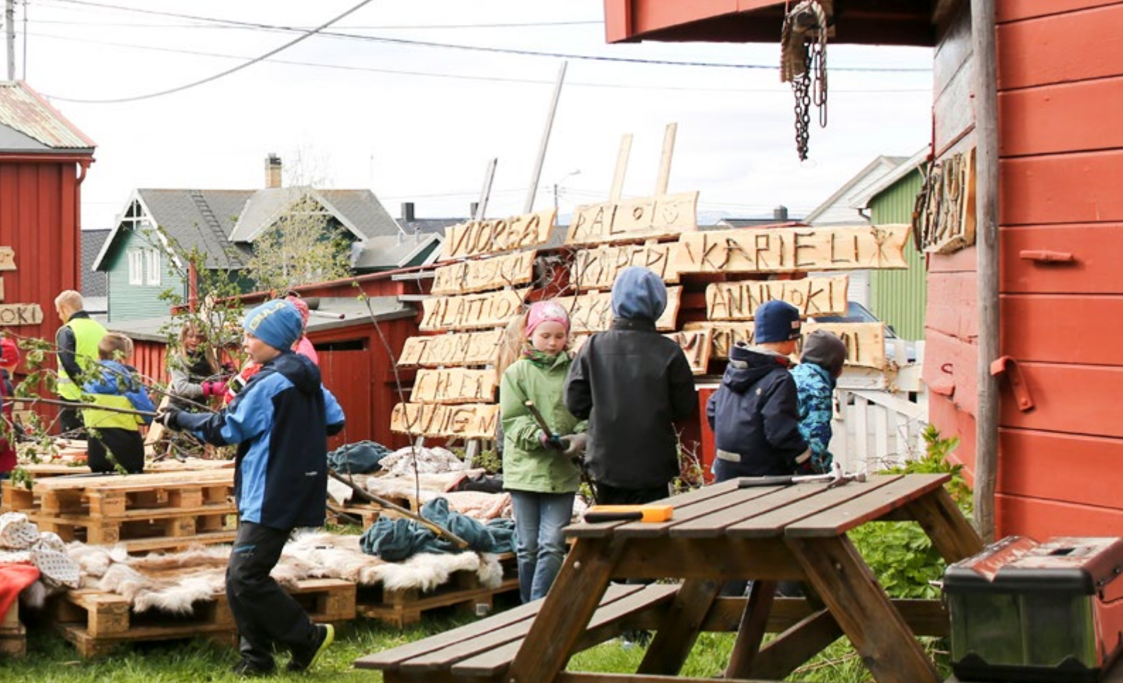
I kvenuka 2016 ble det laget skilt med kvenske stedsnavn i samarbeid med Kvensk stedsnavntjeneste.