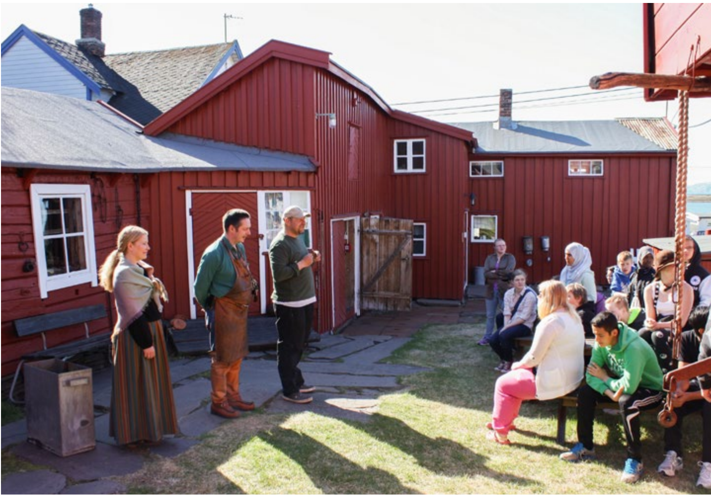
Kvenuka 2013 på Tuomainegården i Vadsø.