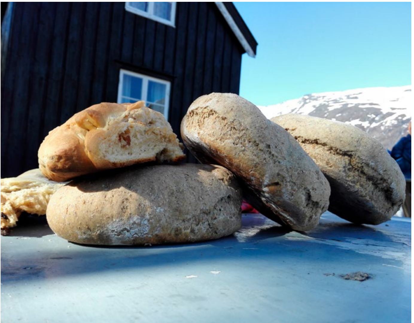
Halti kvenkultursenter og Nord-Troms Museum arrangerer kulturdag på Tørfoss kvengård i Reisadalen hvert år under Paaskiviikko, de kvenske kulturdagene i Nord-Troms. Den gamle steinovnen fyres opp, og publikum får smake på steinovnsbakt brød på kvensk vis. Her fra Paaskiviikko 2017.