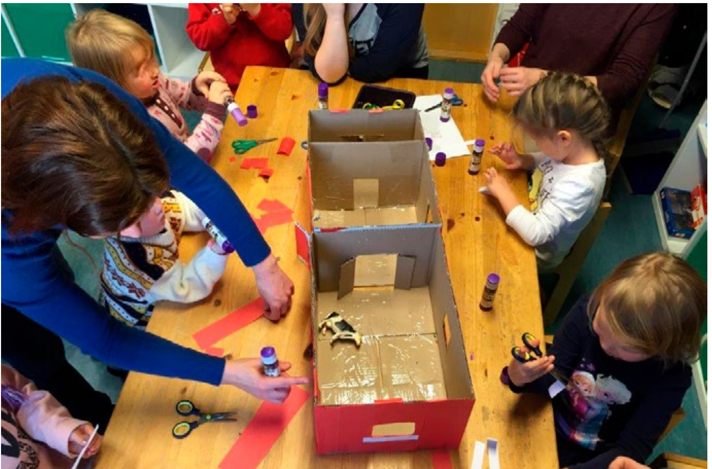
Språkreir i barnehagen.