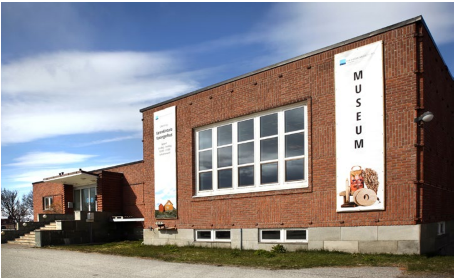
Vadsø museum - Ruijan kvenmuseum. Museet holder til i det tidligere NRK-bygget i Vadsø som ble bygget rett etter krigen. NRKs første disktrikskontor ble etablert i Vadsø 17. mai 1934.