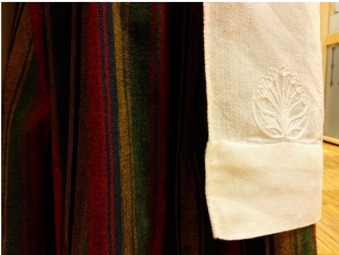
Utsnitt av kvenndrakten (kvinndrakt). Dette er brukt som forsidebilde på Troms fylkeskommunes handlingsplan for kvensk språk og kultur.