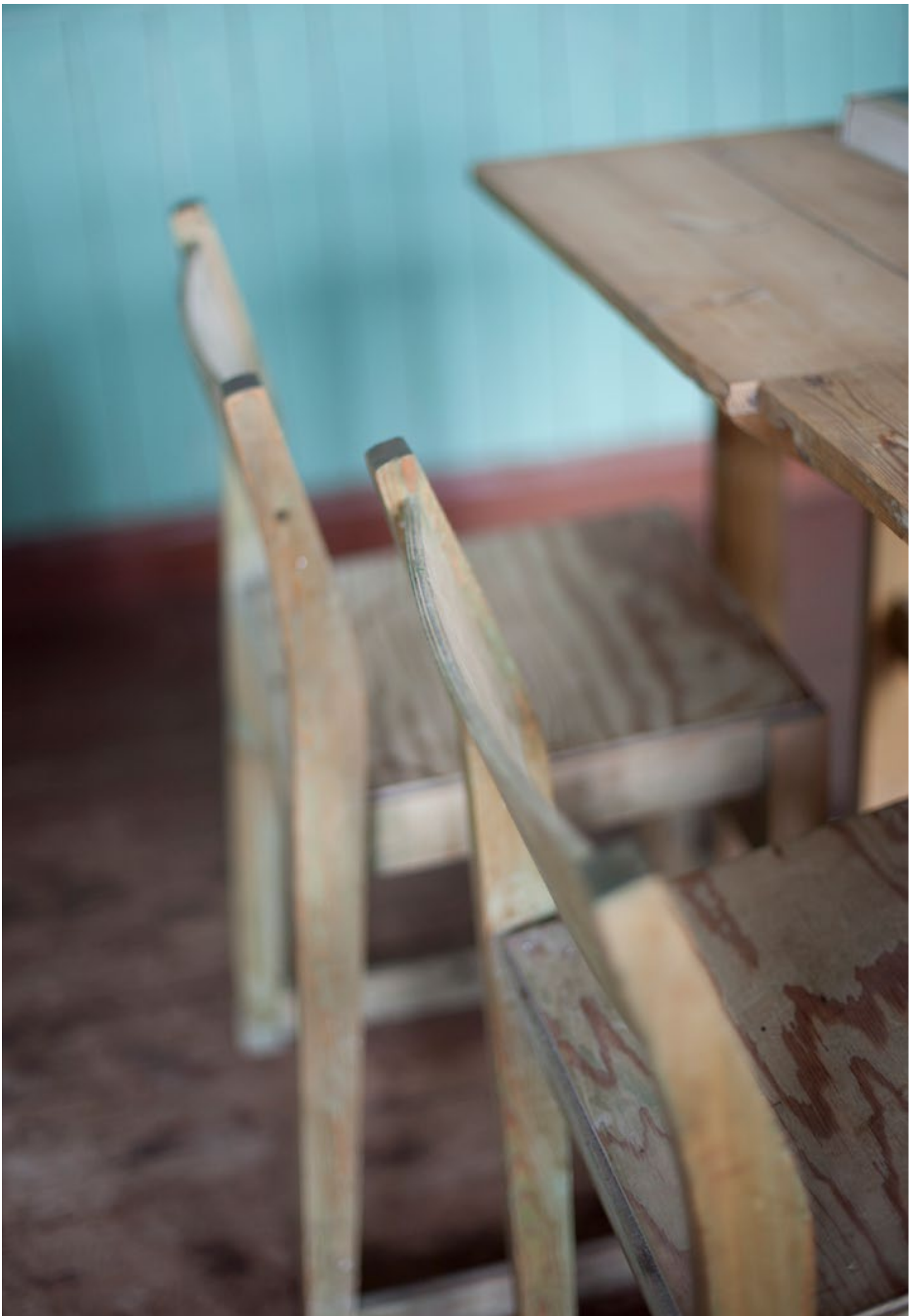
Klasserom Andersby skole.