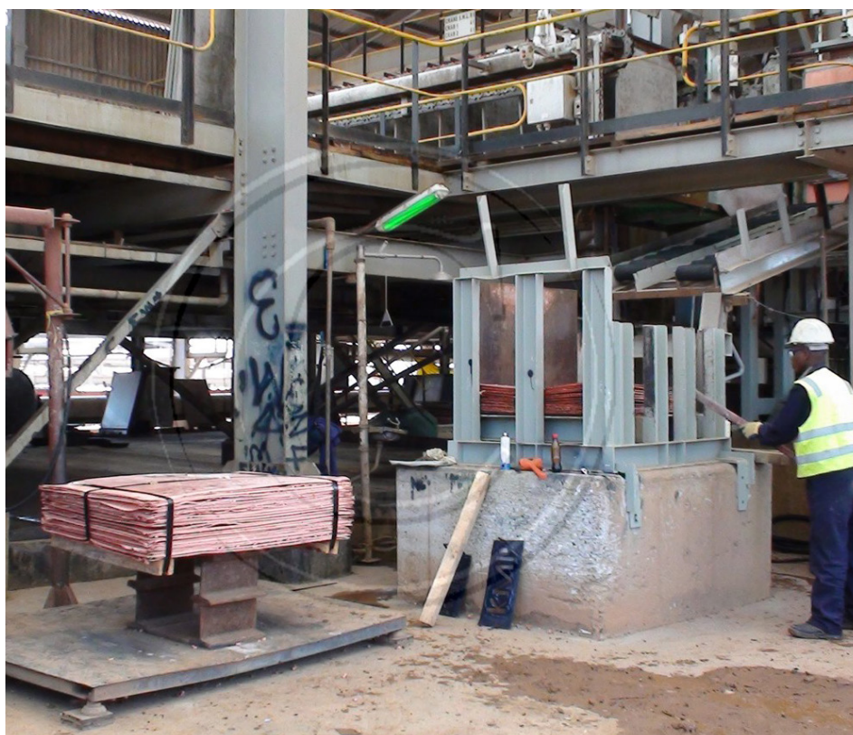
Zambia har betydelig gruveindustri og har vært den største produsenten og eksportøren av kopper i Afrika helt siden 1940-tallet.

De økonomiske analysene baserte seg på tilgang til data fra de fleste store gruveselskapene, skatte- og produksjonsdata fra myndighetene og internasjonale data fra sentrale gruveland. I et samarbeid mellom konsultentselskapet og myndighetene ble det høsten 2007 laget en skattemodell for å kunne analysere virkningen på statens skatteinntekter og selskapenes skattebyrde ved endringer i skattesystemet. Vurderingen var at man ved en omlegging av skattesystemet, samt bedre kontroll og oppfølging, ville kunne oppnå en kraftig økning i skatteinntektene fra gruvesektoren i Zambia. Konsultentselskapet er siden blitt engasjert av ambassaden for å videreutvikle og gi opplæring i skattemodellen til ansatte i skatteadministrasjonen og finansdepartementet i Zambia.