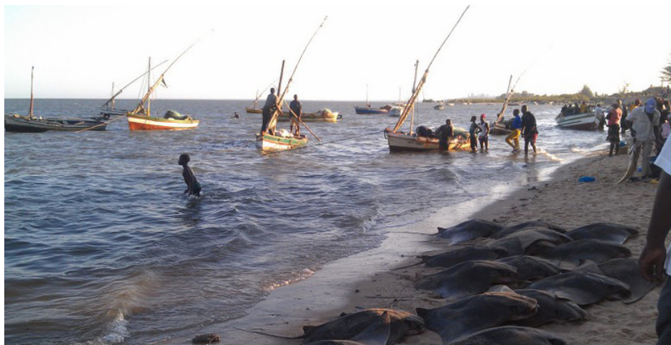
Bilde: Fiskerisektoren er også en viktig inntektskilde i Mosambiks økonomi.

I 2012 blir mulighetene for å utvide samarbeidet til å også omfatte fiskerisektoren vurdert.