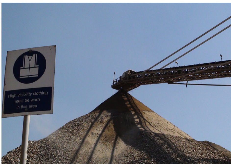
Gruvedrift har lenge vært en viktig del av Tanzanias økonomi. Nylig er det gjort store olje- og gassfunn i tanzanianske farvann.

I 2012 har Norge og Tanzania inngått en avtale om langsiktig norsk støtte til arbeid med rammeverk for naturressurser (petroleum og mineraler). Det skal blant annet omfatte endringer i skattesystemet for naturressurser, mulig reforhandling av avtaler med selskaper, etablering av fondsoppbygging og «handlingsregel», samt fortsatt støtte til EITI-prosessen i Tanzania, som Norge har vært hovedbidragsyter til de siste to årene. Arbeidet skal forankres i skatteetaten i Tanzania.