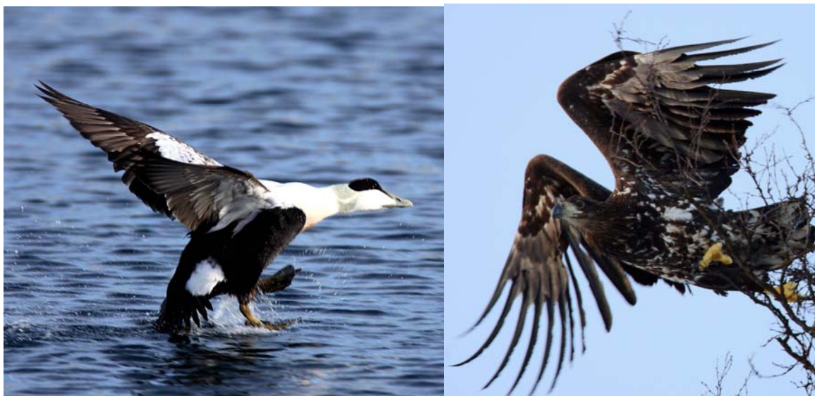
Figur 1 Voksen ærfugl-hann og ung havørn

Blåskjellanlegg legges normalt til fjordområder hvor det marine miljøet gir gode forutsetninger for hurtig vekst og god produksjon. I slike områder finnes det ofte betydelige ærfuglbestander som kan beite ned store deler av produksjonen (Dunthorn 1971, Ross og Furness 2000). Metoder som kan redusere tettheten av ærfugl i nærheten av anlegg vil dermed kunne ha stor kommersiell interesse for næringa. For eksempel er det foreslått at en bør vurdere forekomst av rovfugl i området som en tilleggsfaktor som kan holde ærfuglene borte. Havørn er en naturlig predator på ærfugl og flere oppdrettere nevner også at ørn i nærområdene har en positiv innvirkning på ærfuglplagene (Erikstad et al. 2006). Det samme har også vært vist i studier fra Storbritannia og Sverige (Ross og Furness 2000, Lindahl og Lundberg 2004). Det finnes imidlertid lite kunnskap om dette fra Norge. I denne undersøkelsen studerer vi effekten av havørn på forekomsten av ærfugl i Balsfjord i Troms, en fjord med flere blåskjellkonsesjoner som samtidig er et viktig område for flere vannfugl og rovfugl.