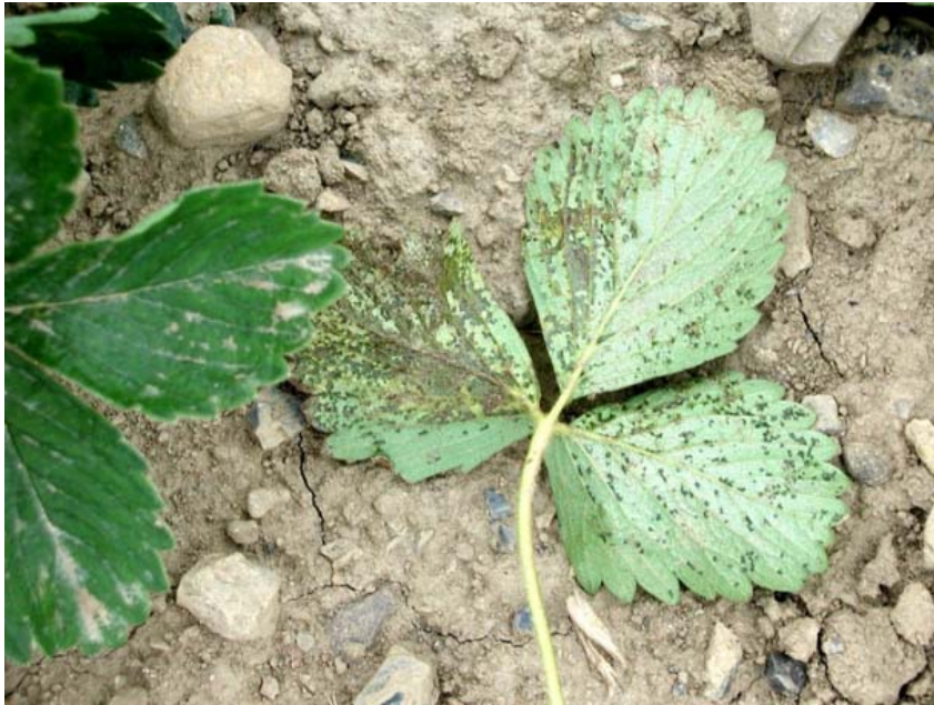
Kraftig angrep av Xanthomonas fragariae