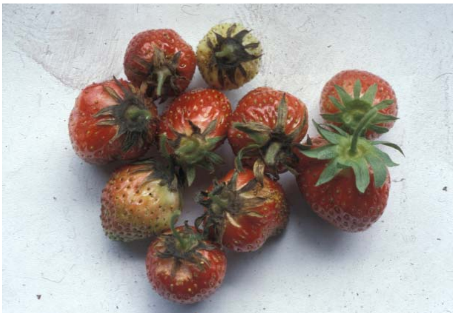
Angrep av Xanthomonas fragariae på begerblad