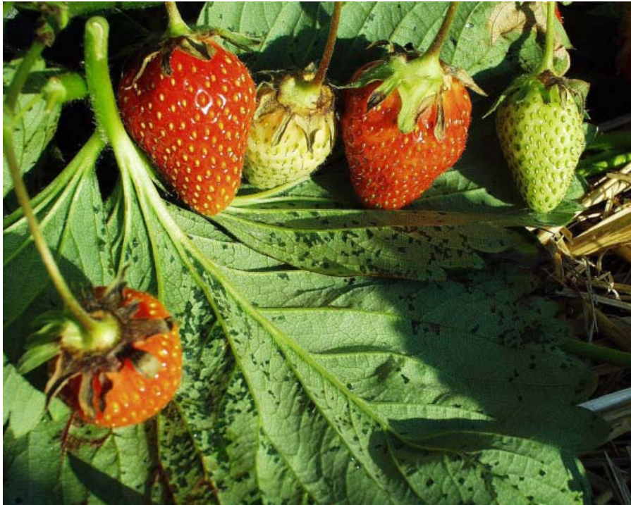
Angrep av Xanthomonas fragariae på blad og begerblad