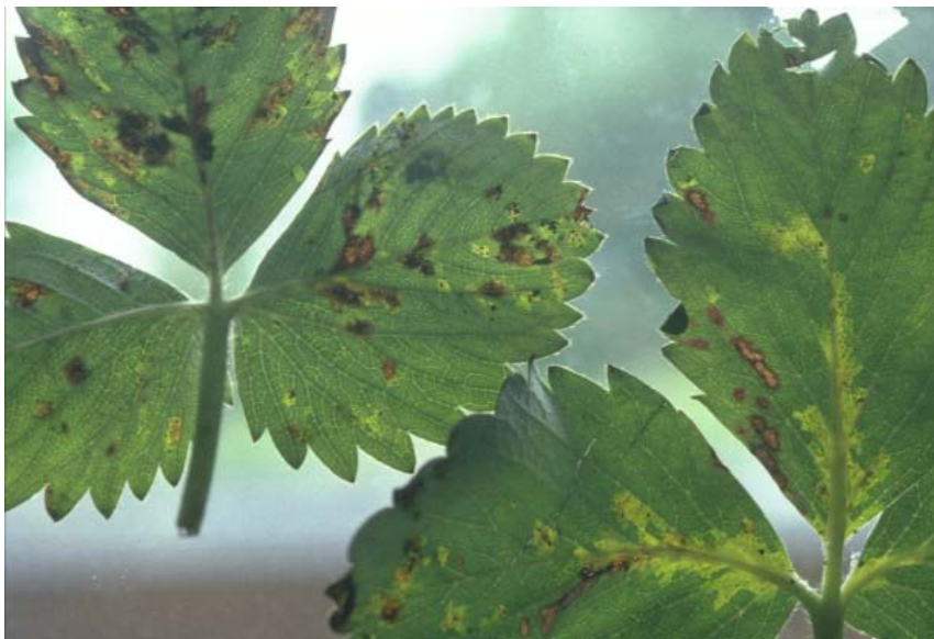
Gjennomskinnelige bladflekker etter angrep av Xanthomonas fragariae