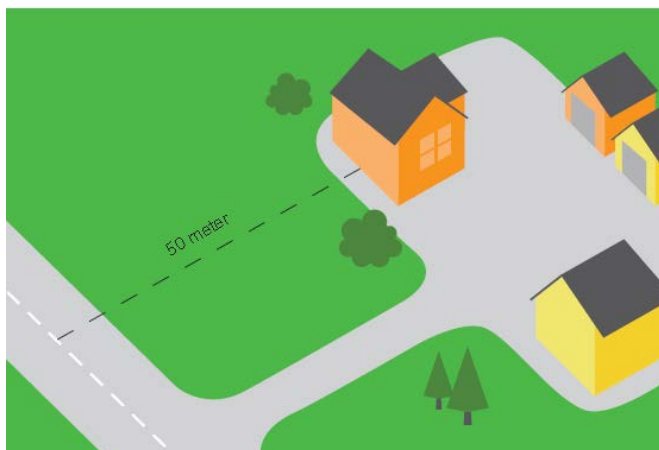
FIGUR 1 BYGGEAVSTAND MOT VEG REKNAST FRÅ VEGEN SI MIDTLINJE

«Byggegrensene skal ta vare på dei krava som ein må ha til vegsystemet og til trafikken og til miljøet som grenser opp til vegen og medverke til å ta vare på miljøomsyn og andre samfunnshensyn.»