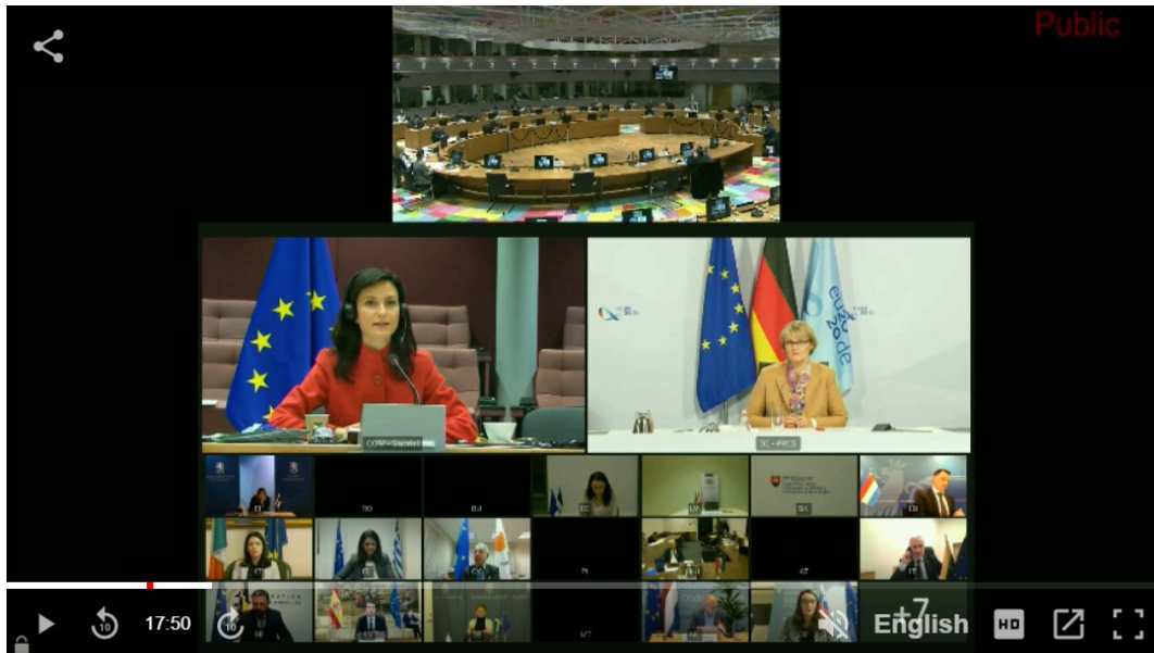
Bilde fra utdanningsministrenes videokonferanse den 30.november. Øverst er møterommet i Rådet, i midten til venstre EU-kommissær Mariya Gabriel og til høyre Tysklands forbundsminister Anja Karliczek. Nederst er de deltagende ministrene.

Mandag 30. november ble det avholdt en uformell videokonferanse for utdanningsministrene i EU. Det var opprinnelig planlagt et formelt rådsmøte, men grunnet covid-19 situasjonen var det ikke mulig å gjennomføre et fysisk møte.