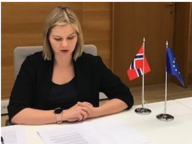
Kunnskaps- og integreringsminister Guri Melby ved seremonien for Osnabrück-deklarasjonen den 30.november.

På møtet uttrykte utdanningsministrene støtte til yringsfrihet og europeiske verdier og uttrykte solidaritet med ofrene for terrorangrepene i Europa i høst. Videre diskuterte de meldingen om Det europeiske utdanningsområdet ( European education area ) og det neste strategiske rammeverket for utdanningssamarbeid, som Europakommisjonen la frem i høst. Diskusjonene tok utgangspunkt i et diskusjonsnotat forberedt av det tyske formannskapet. Det er vedtatt ved skriftlig prosedyre en rådskonklusjon om digital utdanning og en rådsanbefaling om fag- og yrkesopplæring .