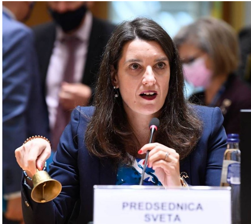
Simona Kustec, Slovenias Minister for utdanning, vitenskap og sport ved Rådsmøtet for utdanning.

grunnskole- og videregående opplæring gir anbefalinger til EUs medlemsland om hvordan blandet læring kan utvikles og tas i bruk. Blandet læring handler om å bruke flere tilnærminger til læringsprosessen, ved å lære på ulike måter og i ulike miljøer. Blandet læring sees på som en mulighet til å øke kvalitet, relevans og inkludering i utdanning og opplæring.