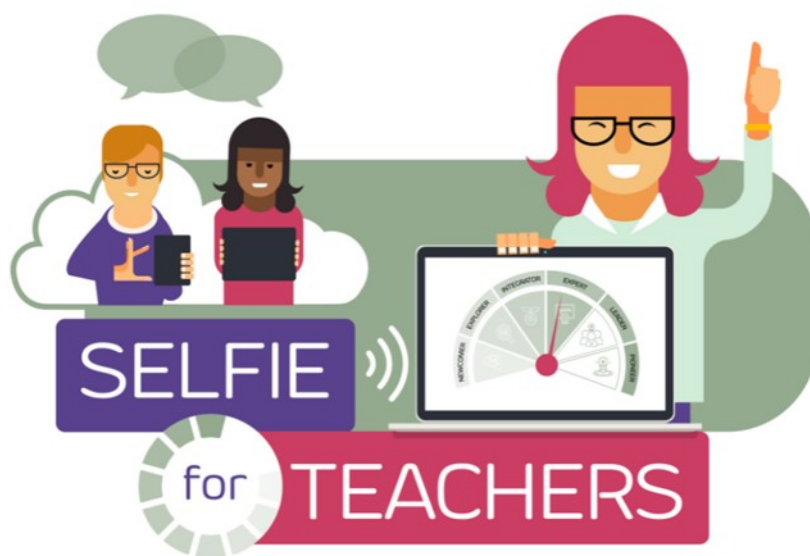
Illustrasjon: Selfie for teachers@EC 2021.

På verdens dag for lærere – 5. oktober – lanserte Kommisjonen et nettbasert verktøy Selfie for Teachers hvor lærere kan gå gjennom og få tilbakemelding på hvordan de bruker digitale verktøy og teknologier. Verktøyet er utviklet for å støtte lærere i grunnskole og videregående utdanning til å reflektere over hvordan de benytter digital teknologi i arbeidet sitt og identifisere hvor de trenger videre opplæring og støtte.