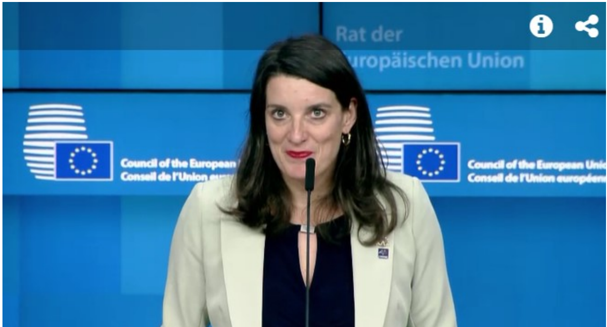
Simona KUSTEC, slovensk minister for utdanning, vetenskap och sport, ved pressekonferanse 28. september.

Mer informasjon om rådsmøtet 28. september her .