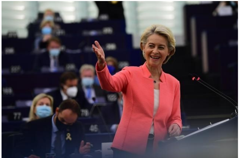
Ursula von der Leyen ved den årlige linjetalen om unionens tilstand, State of the Union.

Europakommisjonens president Ursula von der Leyen holdt 15. september den årlige linjetalen om unionens tilstand («State of the European Union») på Europaparlamentets plenums møte. Talen hadde den spenstige tittelen « styrke sjelen til vår union » og ble etterfulgt av en debatt. Utdanning og forskning ble fremhevet som grunnleggende for flere av Kommisjonens store initiativer, slik som den digitale omstillingen, sikre europeisk konkurransekraft og gjennomføringen av den europeiske søylen for sosial rettigheter. Von der Leyen uttrykte bekymring for påvirkningen pandemien har hatt på unge og annonserte at 2022 blir ungdommens år.