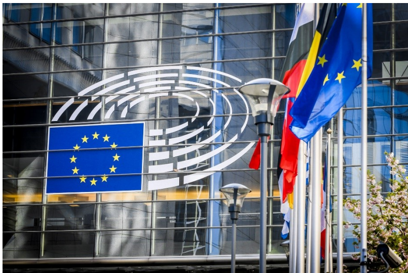
Europaparlamentet, Brussel.

Her finner du kalender og dagsorden for alle møtene i disse komiteene: CULT , EMPL og ITRE .