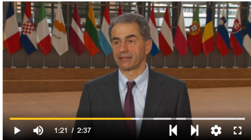
Ankomst- og dørutsagn fra Manuel HEITOR, minister for vitenskap, teknologi og høyere utdanning i Portugal, til rådsmøte for utdanning, som fant sted i Brussel 17. mai 2021.

Den ene rådskonklusjonen omhandler det europeiske universitetsinitiativet og er kalt «det europeiske universitetsinitiativet – en bro mellom høyere utdanning, forskning, innovasjon og samfunn: baner veien for en ny dimensjon i europeisk høyere utdanning».