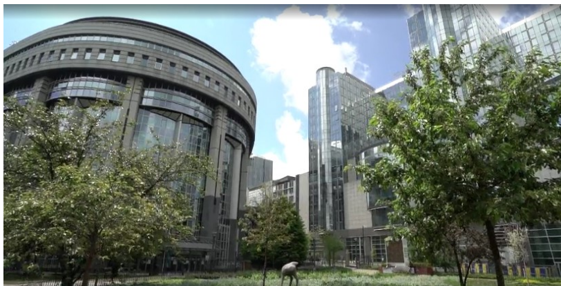
Europaparlamentet under plenumsesjon i mai.

20. mai. Rapporten er bredt innrettet og legger blant annet vekt på de etiske aspektene ved bruk av kunstig intelligens i utdanning, og aspekter knyttet til diskriminering og kjønn. Rapporten legger videre vekt på behovet for grunnleggende digital kompetanse, avansert digital kompetanse og den