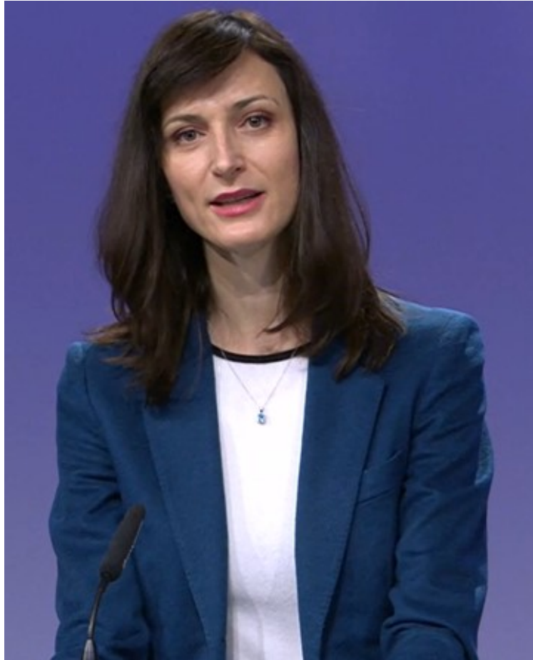
Kommissær Mariya Gabriel ved pressekonferanse 25. mars.

Onsdag 24. mars lanserte Europakommisjonen "Open Research Europe", en åpen publiseringsplattform med fritt tilgjengelig vitenskapelige artikler fra Horisont 2020 og Horisont Europa. Planene om "Open Science Europe" ble lansert i meldingen om et nytt Europeisk forskningsområde (ERA) (sep. 2020). Her kan du lese pressemelding og søke etter innhold på portalen .