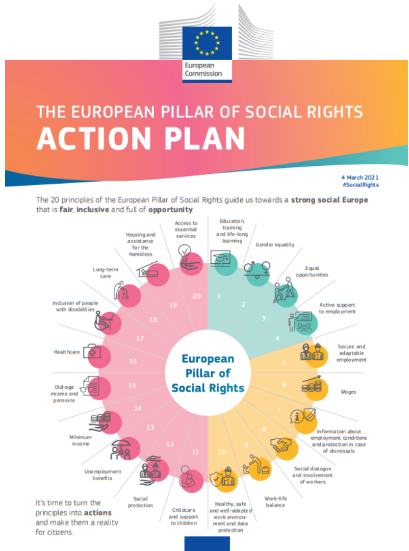
Illustrasjon: EU's sosiale søyle.

Europakommisjonen frem en handlingsplan for den europeiske pilaren for sosiale rettigheter. Den europeiske pilaren for sosiale rettigheter ble underskrevet av Rådet, Europaparlamentet og Kommisjonen på det sosiale toppmøtet i Gøteborg i november 2017. Pilaren består av 20 prinsipper, hvorav det første prinsippet omhandler utdanning: "Everyone has the right to quality and inclusive education, training and life-long learning in order to maintain and acquire skills that enable them to participate fully in society and manage successfully transitions in the labour market". Handlingsplanen skal blåse liv i arbeidet med den europeiske pilaren for sosiale rettigheter og skal bidra til å realisere pilaren gjennom konkrete tiltak. Handlingsplanen som ble lagt frem omtaler kompetanse særskilt under overskriften Investering i kompetanse og utdanning gir nye muligheter for alle .