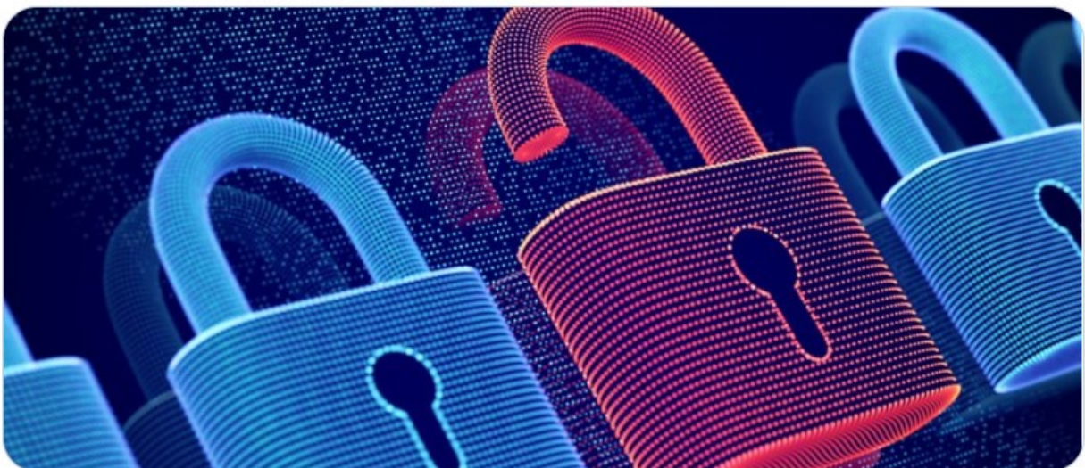
Open Science.