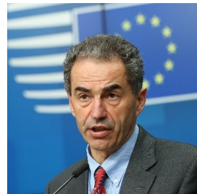
Manuel Heitor, Portugisisk minister for vitenskap, teknologi og høyere utdanning.

I tillegg ble det understreket at forskning og innovasjon er helt avgjørende for å kunne nå målene i EUs grønne giv og den digitale transformasjon.