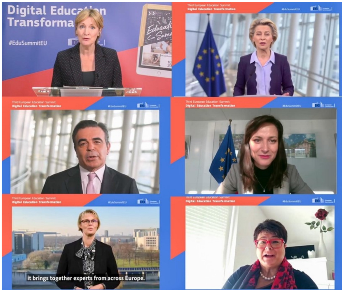
Bilde fra Education Summit.

Torsdag 10. desember arrangerte Europakommisjonen for tredje gang utdanningskonferansen Education Summit . Temaet for konferansen var omstilling til digital utdanning og blant innlederne på denne høynivåkonferansen var Europakommisjonens president Ursula von der Leyen, Kommissær Mariya Gabriel, parlamentarikere fra Europaparlamentet og en rekke utdanningsministre fra EUs medlemsland. En av hovedinnlederne var ungarske Judit Polgar, en av sjakkhistoriens sterkeste kvinnelige sjakkspillere. Hun fortalte om sitt arbeid med å utvikle et sjakkopplegg for å lære barn å tenke logisk, strategisk og kreativt, og som nå brukes av skoler over hele Ungarn.