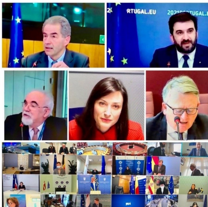
Bilde fra Uformelt ministermøte for utdanning 22. januar.

Her kan du lese pressemeldingen i etterkant av møtet fra det portugisiske formannskapet. Pressekonferansen i etterkant av videomøtet kan sees her .