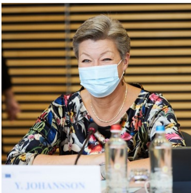
Kommissær Ylva Johansson den 19.oktober 2020.

I Parlamentets plenums møte 19. - 23. oktober vedtok Parlamentet en resolusjon om fremtiden til europeisk utdanning i lys av covid-19. Resolusjonen handler om effekten pandemien har hatt på tilgangen til utdanning.