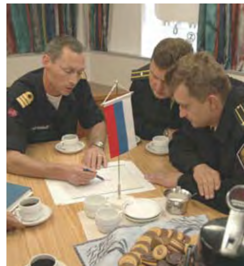
Подведение итогов учения «Баренц Рескью 2006» на борту норвежского корабля береговой охраны «Анденес» с участием представителей Норвежской и Российской береговой охраны

Отличительной чертой норвежского управления ресурсами является сочетание активного государственного регулирования с неукоснительным соблюдением законности и международным сотрудничеством. Современное международное право предоставляет широкий выбор средств воздействия, которые Норвегия может использовать в своей работе по управлению ресурсами, которое основывается на знаниях и ориентируется на достижение результатов. В противоположность развитию в ряде других морских регионов, сочетание эффективного регулирования со стороны Норвегии как прибрежного государства и широкого сотрудничества с другими прибрежными и прочими государствами, чьи интересы затронуты, привело к восстановлению таких важных и в то же время подверженных риску рыбных популяций, как треска и сельдь.